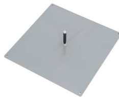
400 x 400 [mm] 5,4 kg