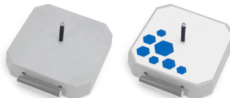
PB 370 R25 370 x 370 x 80 [mm], 25 kg