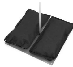
1 x 10 kg