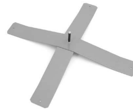
1000 X 1000 x 40 [mm] 8,4 kg