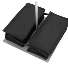
2 x 15 kg