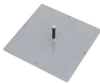
300 x 300 [mm] 2,2 kg