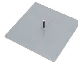
500 x 500 [mm] 10 kg