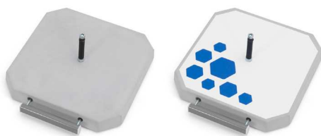
PB 370 R15 370 x 370 x 50 [mm], 15 kg