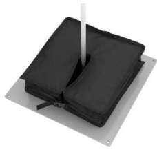
1 x 20 kg